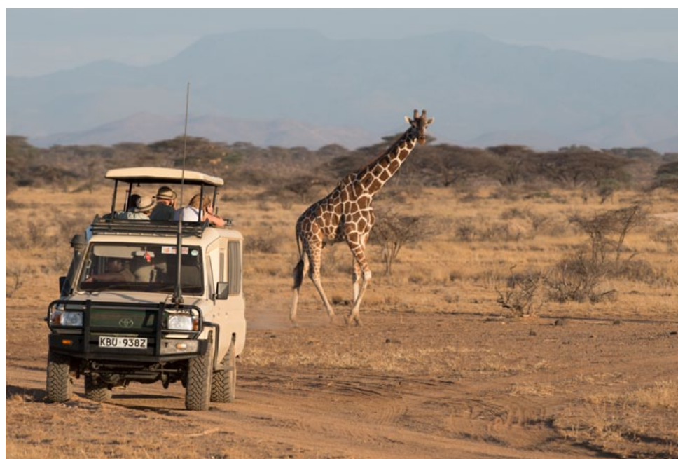
Als er maximaal vier personen in een groot voertuig zitten, heeft iedereen de kans om elke fotokans te benutten.

Hoe kleiner de groep, hoe meer persoonlijke feedback je mag verwachten van de begeleidende fotograaf.