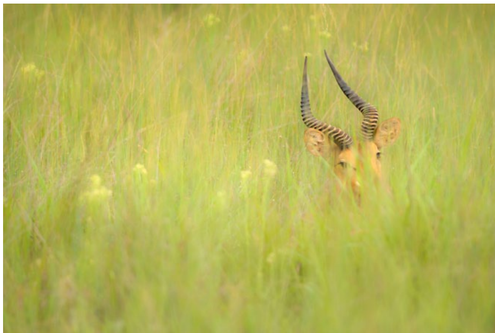
Het regenseizoen maakt het veel moeilijker om dieren te spotten en te fotograferen.

Hoe kleiner de groep, hoe meer persoonlijke feedback je mag verwachten van de begeleidende fotograaf.